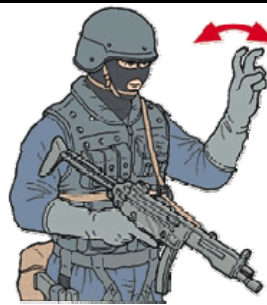
FORMAZIONE A COLONNA