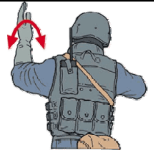
FORMAZIONE A FILE AFFIANCATE