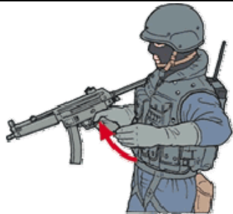
PUNTO DI ENTRATA