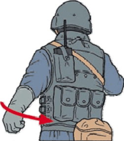
FORMAZIONE A CUNEO